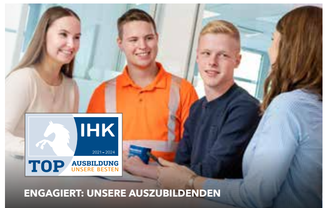
ENGAGIERT: UNSERE AUSZUBILDENDEN