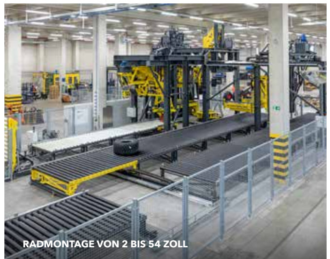
RADMONTAGE VON 2 BIS 54 ZOLL

An eigenen Montageplätzen montieren wir schnell und fachgerecht pro Tag bis zu 800 Räder von 2 bis 54 Zoll. Von einfachen Schubkarrenrädern über Komplettäder für Traktoren bis hin zur Sprengringmontage für Erdbewegungs- und Industriereifen. Im Bereich Flotation sind wir der einzige Lieferant in Europa, der eine rundlaufoptimierte Montage aller ausgelieferten Räder anbietet.