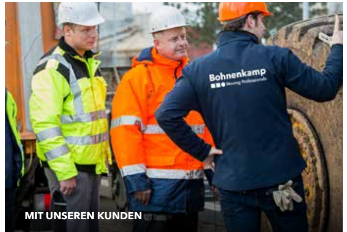
MIT UNSEREN KUNDEN

Über ein umfassendes Netzwerk von 26 Standorten für 30 Länder sind wir im gesamten Vertriebsgebiet direkt vor Ort. In unseren regional unabhängigen Landesgesellschaften und Vertriebsbüros stehen unseren Kunden hierfür mehr als 80 Mitarbeiter im Außendienst mit Rat und Tat zur Seite.