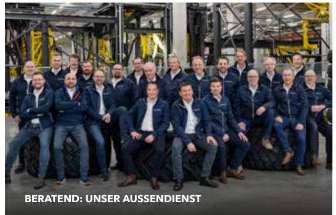
BERATEND: UNSER AUSSIEDIENST