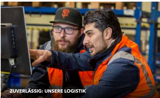
ZUVERLÄSSIG: UNSERE LOGISTIK