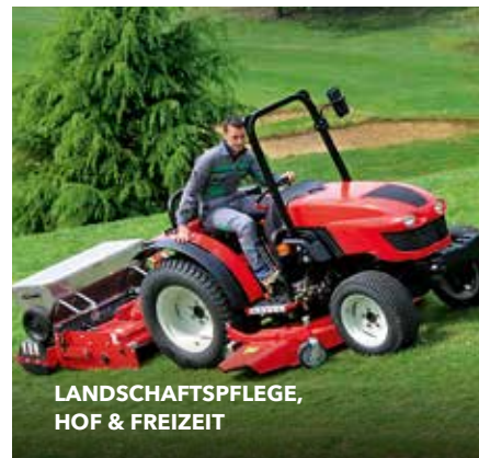
LANDSCHAFTSPFLEGE, HOF & FREIZEIT

Als Großhändler setzen wir zu 100 Prozent auf Fachhandel und Hersteller. Mit unseren Experten unterstützen wir Sie bei der Flotten- und Anwenderberatung sowie bei der Entwicklung von Spezial- und Sonderlösungen in der Erstausrüstung.