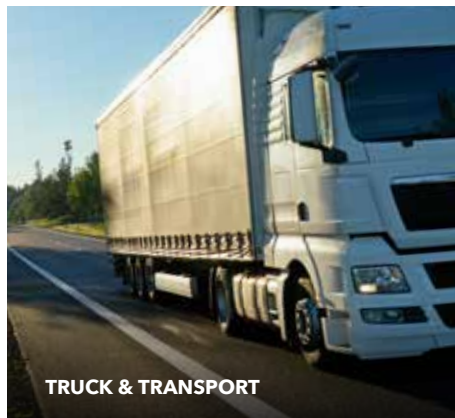
TRUCK & TRANSPORT