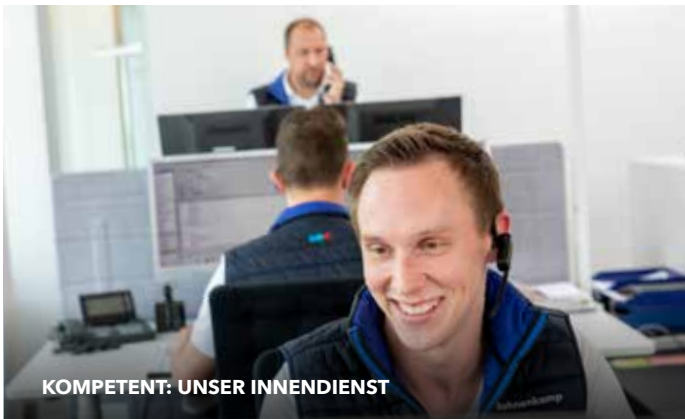
KOMPETENT: UNSER INNEDIENST

Unterstützt werden unsere Experten durch unseren Online-Shop und unsere App, über die der Handel rund um die Uhr Zugriff auf das gesamte Sortiment und auf alle technischen Daten hat.